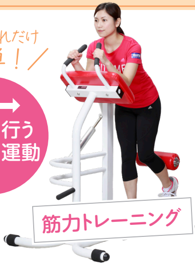
筋力トレーニング